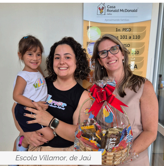
Escola Villamor, de Jaú