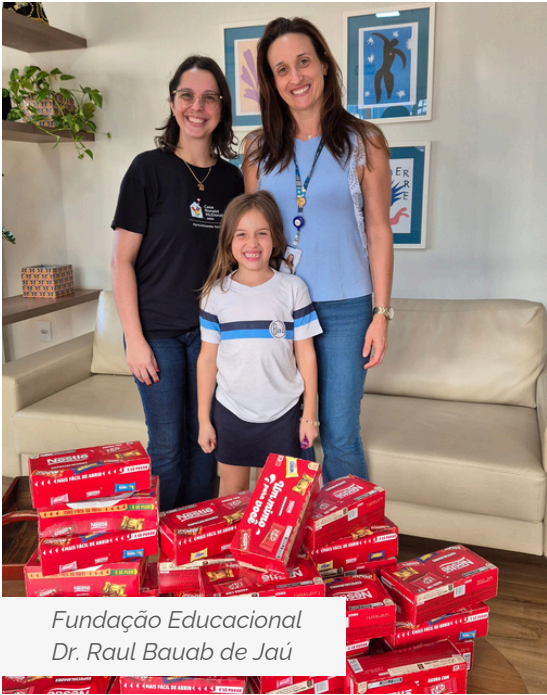
Fundação Educacional Dr. Raul Bauab de Jaú