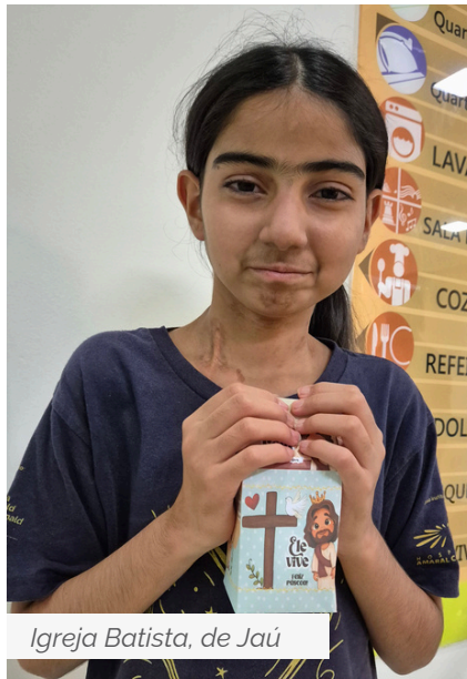
Igreja Batista, de Jaú