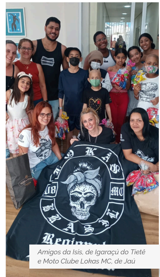
Amigos da Isis, de Igarazú do Tietê e Moto Clube Lokas MC, de Jaú

Agradecemos também a todos os doadores anônimos de Jaú e região.