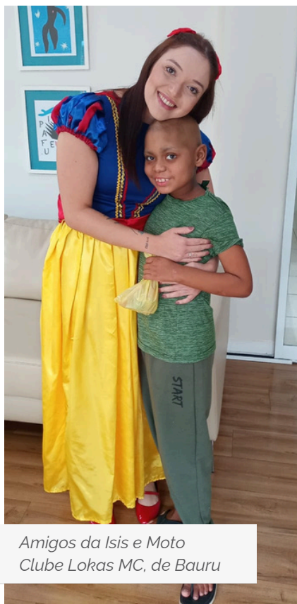
Amigos da Isis e Moto Clube Lokas MC, de Bauru